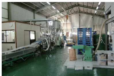
整理整頓された工場内

同社はMICで2008年9月にISO9001の認証取得をされました。「当初、『ものづくり』の会社としてはお客様に認められる良質のものを作っていただければ自然にお客様がついてきてくれると思って