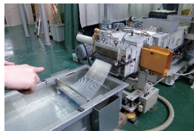
工程からの一コマ

人づくりにも力を注いでこられました。例えば、パートや派遣社員は雇わず、全員正社員として雇用しています。熟練工を育て会社の技術を